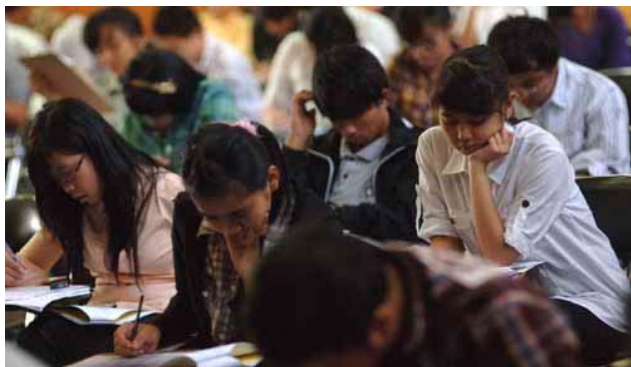
Seleksi Masuk Universitas Padjadajaran (SMUP) 2009 di Aula Graha Sanusi Hardjadinata Unpad Jln. Dipatiukur Kota Bandung.

Untuk menjalani perkuliahan dengan baik, mahasiswa niscaya membutuhkan berbagai fasilitas pendukung. Dalam memenuhi hal tersebut, mau-tak mau dana menjadi syarat yang mutlak. Menurut Kompas (5 Mei 2009) dalam berita yang berjudul, “Unpad Tidak Tingkatkan Kuota SMUP”, beban biaya ideal ( unit cost ) yang ditetapkan pemerintah adalah Rp. 18 juta per tahun per mahasiswa.