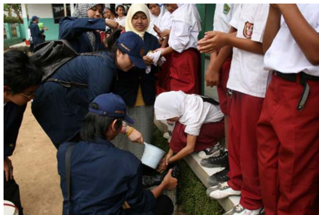
Salah satu kegiatan KKNM-PKM Pengabdian, "cara-cara hidup bersih sejak dini" di salah satu sekolah dasar di Kabupaten Purwakarta oktober-desember 2008.